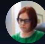
SOC Director, Fortune 100 Chemicals

"Copilot mi ha permesso di ridurre le perdite di tempo. Per portare avanti un'indagine non devo più servirmi di una miriade di strumenti, tutti diversi tra loro. "