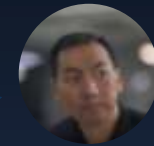
CISO, Global Ecommerce

"Quando dobbiamo fare un check dei IOCs, un analista impiega in media tra i 10-15 minuti circa . Per fare lo stesso, Security Copilot ha impiegato solo 3 minuti. "